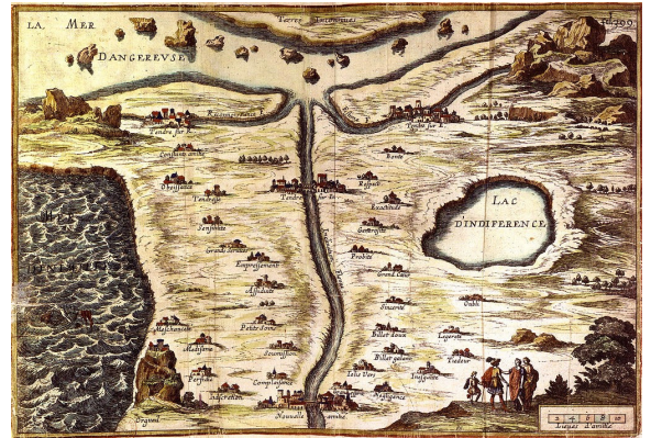
La Carte du Tendre, Paris, 1856.

Application en ligne, accessible via un navigateur.