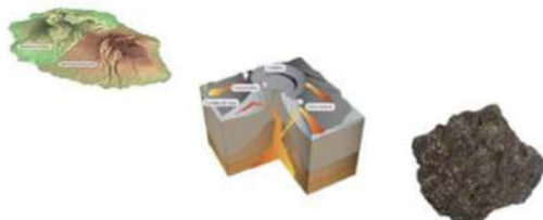
Conception-réalisation du kit pédagogique

En novembre 2005, le projet a été sélectionné pour être présenté à la conférence « Communicating European Research » qui se tenait à Bruxelles avec 240 exposants de l'Europe entière venus présenter leurs initiatives dans le domaine de la médiation des connaissances scientifiques vers un large public.