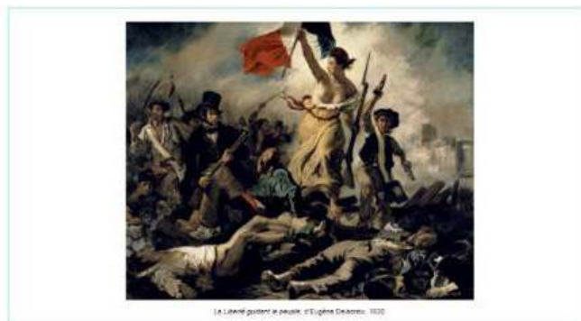
La Liberté guidant le peuple, d'Eugène Delacroix, 1830

La Liberté guidant le peuple - j'étudie une image