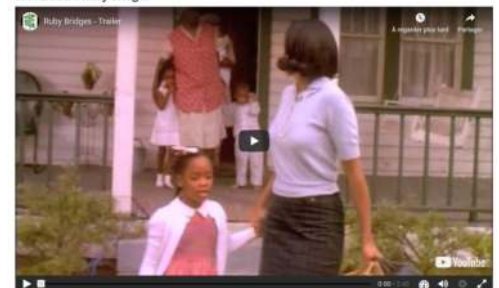
Film trailer : Ruby Bridges

Answer the questions (based on the film trailer) in your copybook.