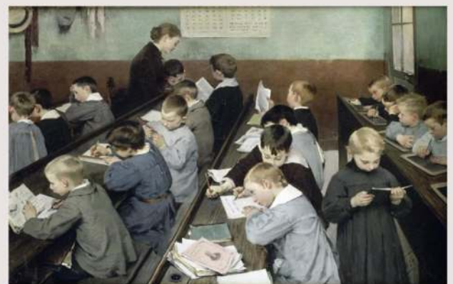
EN CLASSE, LE TRAVAIL DES PETITS.