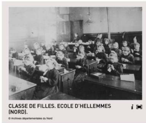
CLASSE DE FILLES. ECOLE D'HELLEMES (NORD).