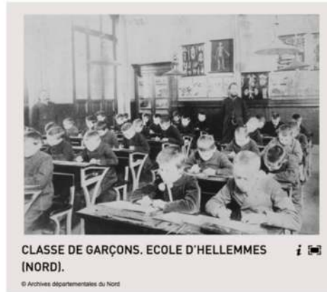
CLASSE DE GARÇONS. ECOLE D'HELLEMES (NORD).

Cette ressource, composée de deux photographies, permet de voir la réalité de deux écoles primaires à la fin du XIXe siècle. La première chose qui interpelle est la séparation des sexes : à l'époque, il n'y a généralement pas de mixité dans les classes.