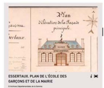
ESSERTAUX. PLAN DE L'ÉCOLE DES GARÇONS ET DE LA MAIRIE